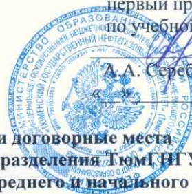
График зачисления на бюджетные и договорные места очной и заочной формы обучения в подразделения ТЮМГНГУ, реализующие программы высшего, среднего и начального профессионального образования

1. График зачисления на бюджетные места очной формы обучения с полным сроком освоения образовательной программы в подразделения ТЮМГНГУ, реализующие программы подготовки бакалавров и специалистов высшего профессионального образования (5 августа 2011г):