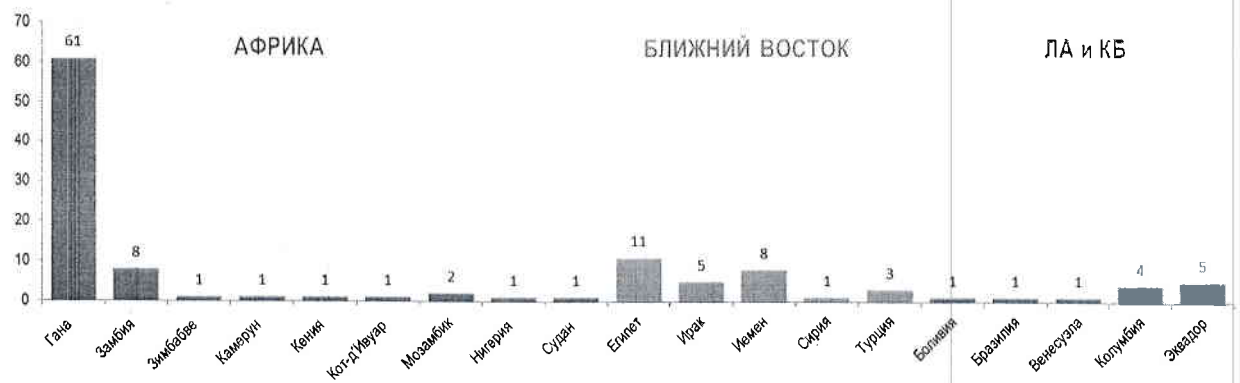
Рис.4 Количество иностранных обучающихся из макрорегионов «Ближний Восток», «Латинская Америка и страны Карибского Бассейна» и «Африка» (чел.)

Усиление позиций ТИУ на данных региональных рынках образовательных услуг возможно, прежде всего, через реализацию активного взаимодействия с рекрутинговыми агентствами (Египет/ Иемен/ Турция/ Ирак/ Ливан/ Сирия/ Иордания / Эквадор/ Перу/ Чили/ Колумбия/ Боливия/ Венесуэла / Аргентина / Куба / Гана/ Ангола/ Камерун / Кот-д'Ивуар / Замбия / Мозамбик / Зимбабве / Нигерия / Судан).