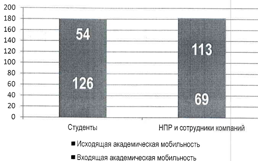
Рис.2 Соотношение параметров входящей и исходящей академической мобильности (2018г)

Численность иностранных НПР, трудоустроенных в ТИУ на постоянное место работы составляет три человека (в т.ч. два кандидата наук, доцента) из таких стран, как Казахстан, Украина, Германия. В течение года для преподавания в университете, проведения воркшопов и мастер-классов привлекаются и иные зарубежные НПР. В частности на протяжении многих лет Институт архитектуры и дизайна ТИУ сотрудничает с Бранденбургским техническим университетом (БТУ) г. Коттбус (ФРГ), Национальным университетом архитектуры и строительства Армении, г. Ереван, Казахским государственным женским педагогическим университетом (Казахстан), Университетом прикладных наук им.Бойта (ФРГ).