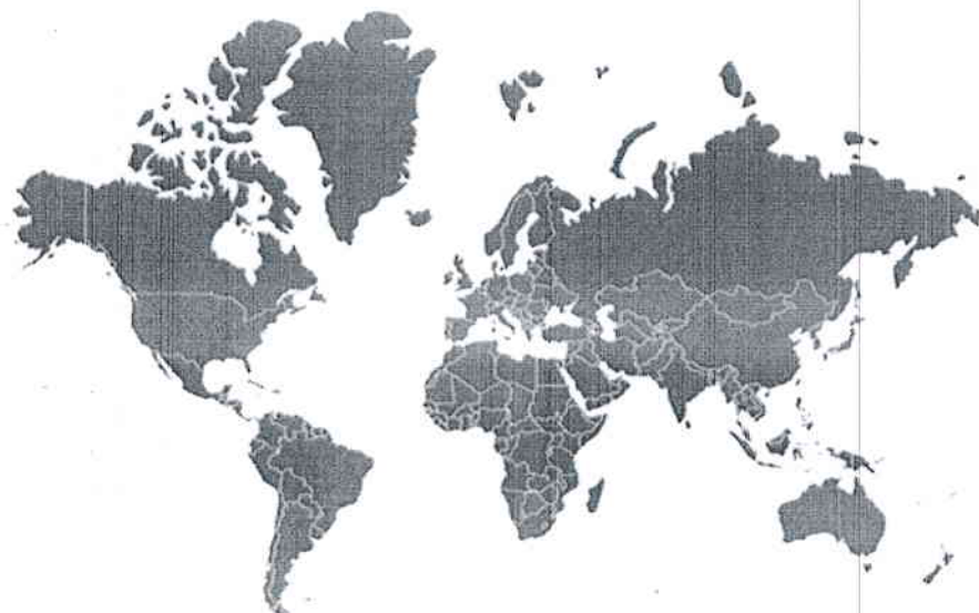
Рис.1 География рекрутинга иностранных обучающихся

Регионально-географическая специфика обусловлена локализацией университета. Ближайшими соседями Тюменской области являются государства Средней Азии, оттуда и идет основной поток иностранных обучающихся. С другой стороны в странах АТР и особенно в странах Африки в последние десятилетия активно развивается нефтегазовая отрасль, а значит требуется все больше высококвалифицированных кадров. Рекрутинг студентов из стран Европы затруднителен в виду их ориентированности на университеты центральной части России, из стран Латинской Америки в виду географической удаленности.