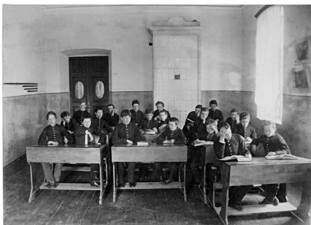
Класс в гимназии. Тюмень, 1889 год

«Учитель! перед именем твоим позволь смиренно преклонить колени!» - цитата из стихотворения Николая Алексеевича Некрасова о Виссарионе Григорьевиче Белинском. Об этом мы узнаём на уроках литературы.