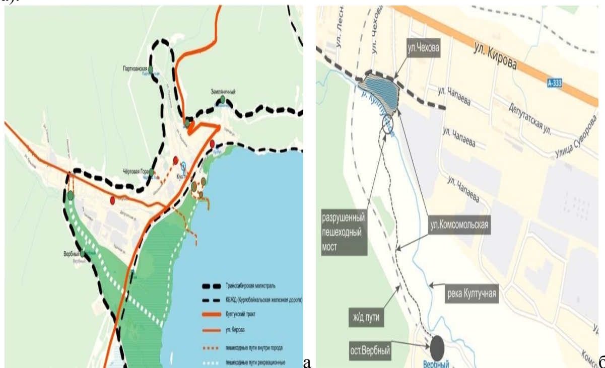
Рисунок 1 – Палан схемы: а – транспортно-пешеходная схема поселка Култук; б – ситуационная схема речки Култучная и заводи.

Култук – первое русское поселение на юге Байкала, основанное в месте кочевий тунгусского рода кумкагиров осенью 1647 года землепроходцем Иваном Похабовым. Расположен на юго-западной оконечности озера, на берегу залива Култук, при впадении речек Култучная и Медлянка [1, с. 3]. Култукский тракт на подъезде к поселку Култук переходит в главную осевую улицу Кирова (рис. 1, а).