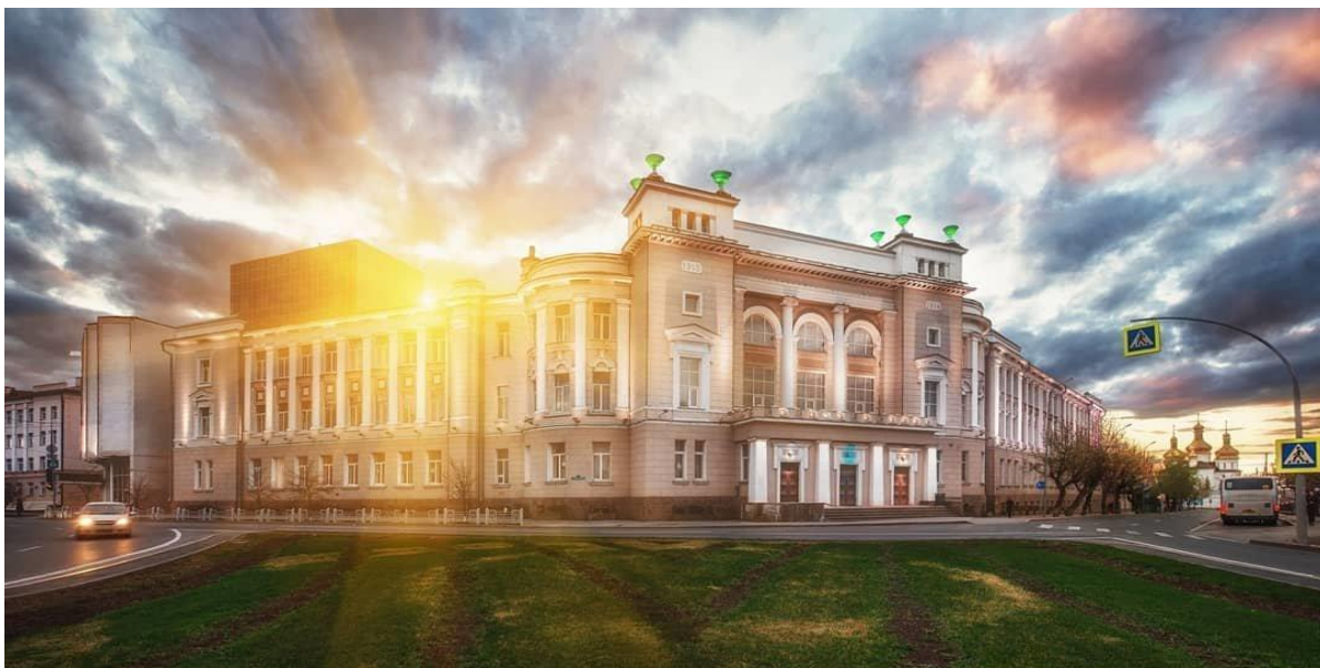
Здание тюменского индустриального университета (нач. XXI в.) г. Тюмень, 8 корпус ТИУ, ул.Луначарского, 2