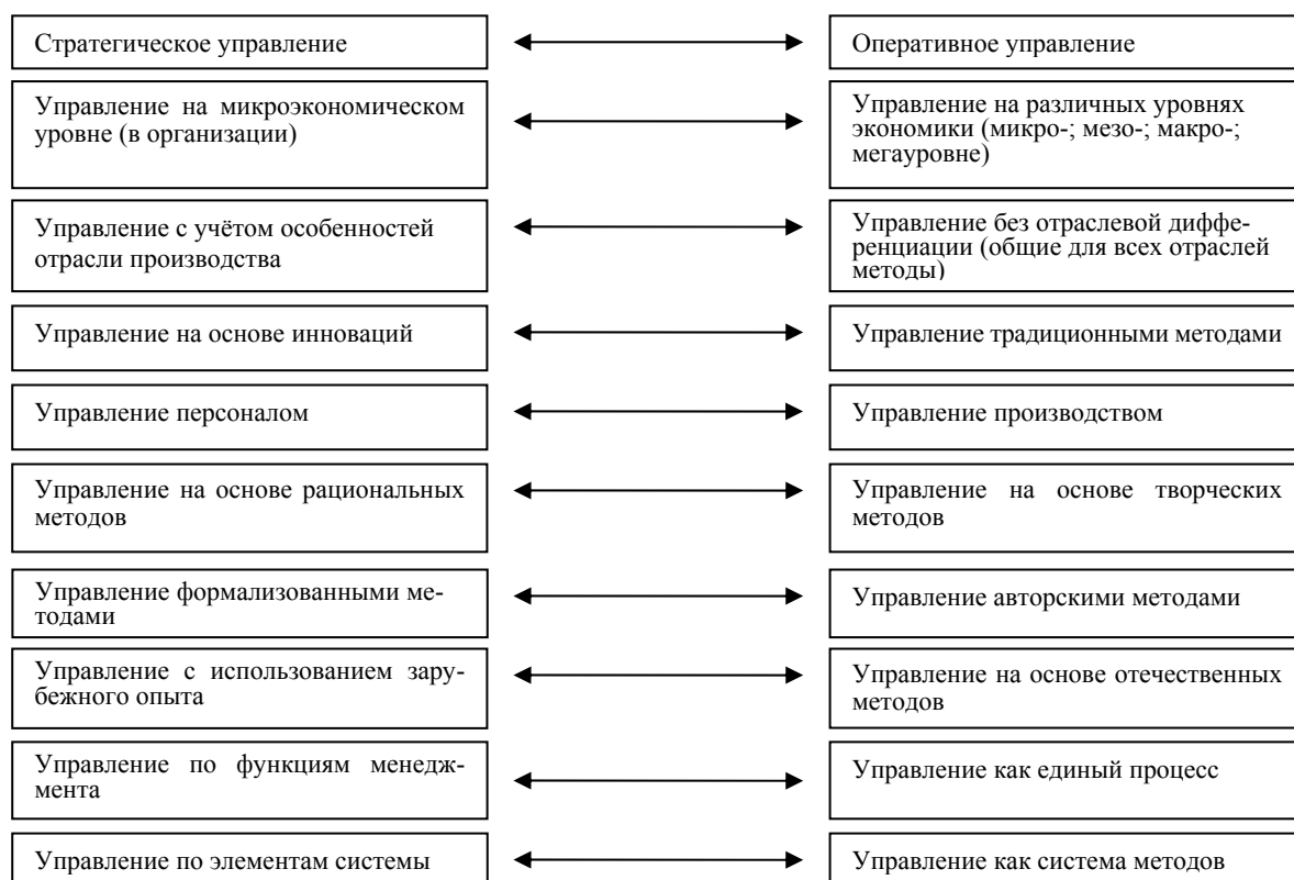
Рис. 2. «Диалектические пары», возникшие в результате дифференциации теории антикризисного управления

Вместе с тем различные направления дифференциации теории антикризисного управления (как и подходы к формированию ее научной концепции) не являются взаимоисключающими, они отражают широкий спектр исследуемых учеными проблем, логично дополняя друг друга, и имеют равные права на существование в научной теории. Применение метода диалектического познания позволяет не только анализировать процессы формирования и современного развития научной теории антикризисного управления, но и осуществлять экстраполяцию тенденций ее развития в будущем.