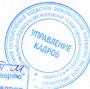
Дадаева Т. М.

Даю согласие на использование моих персональных данных.