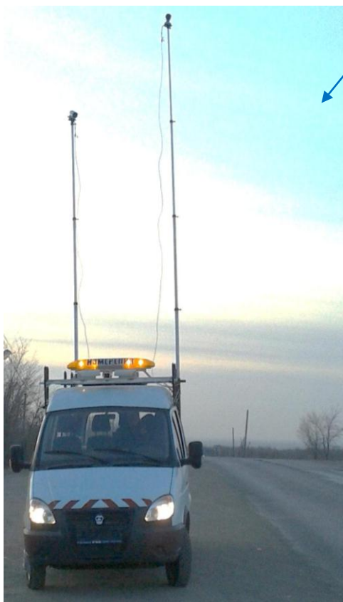
Передвижная транспортная лаборатория