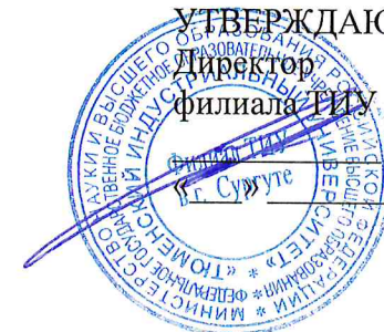
График прохождения практической подготовки в форме практики обучающимися СРЕДНЕГО ПРОФЕССИОНАЛЬНОГО ОБРАЗОВАНИЯ на 2023-2024 учебный год