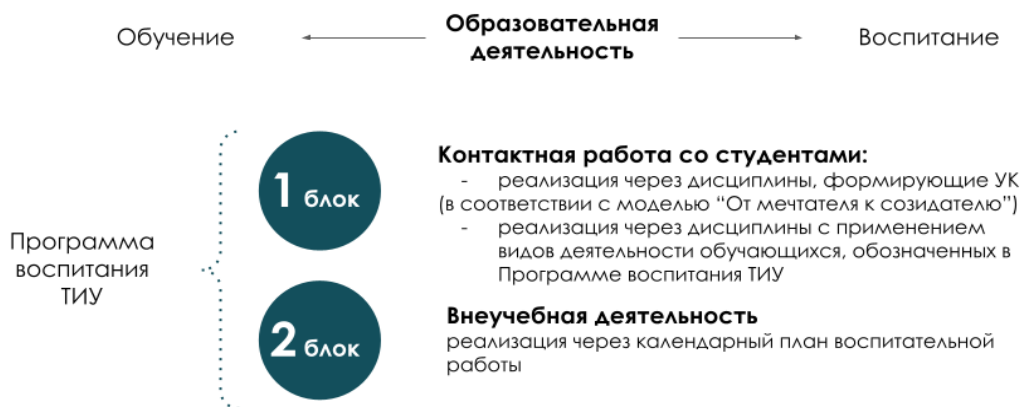
Рис. 1 Воспитательные компоненты в образовательном пространстве

Воспитательная компонента встраивается в образовательное пространство ТИУ в соответствии с компетентностной моделью «От Мечтателя к Созидателю» (в соответствии с Программой воспитания ТИУ «Созидатель – мой образ жизни») через два блока (рисунок 1):