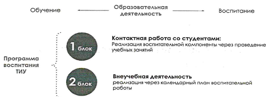
Рис. 1 Встраивание в образовательное пространство воспитательной компоненты