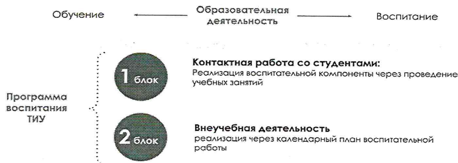
Рис. 1 Встраивание в образовательное пространство воспитательной компоненты