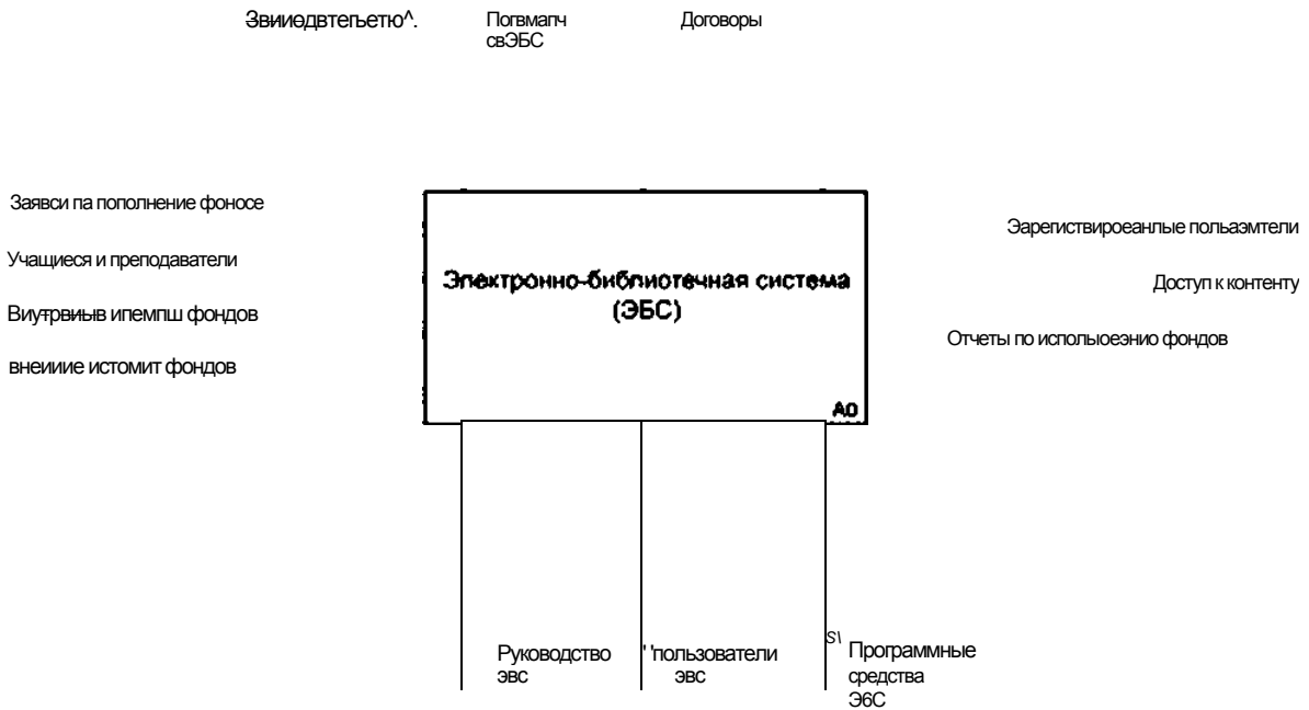
Рисунок А.1 — Контекстная диаграмма