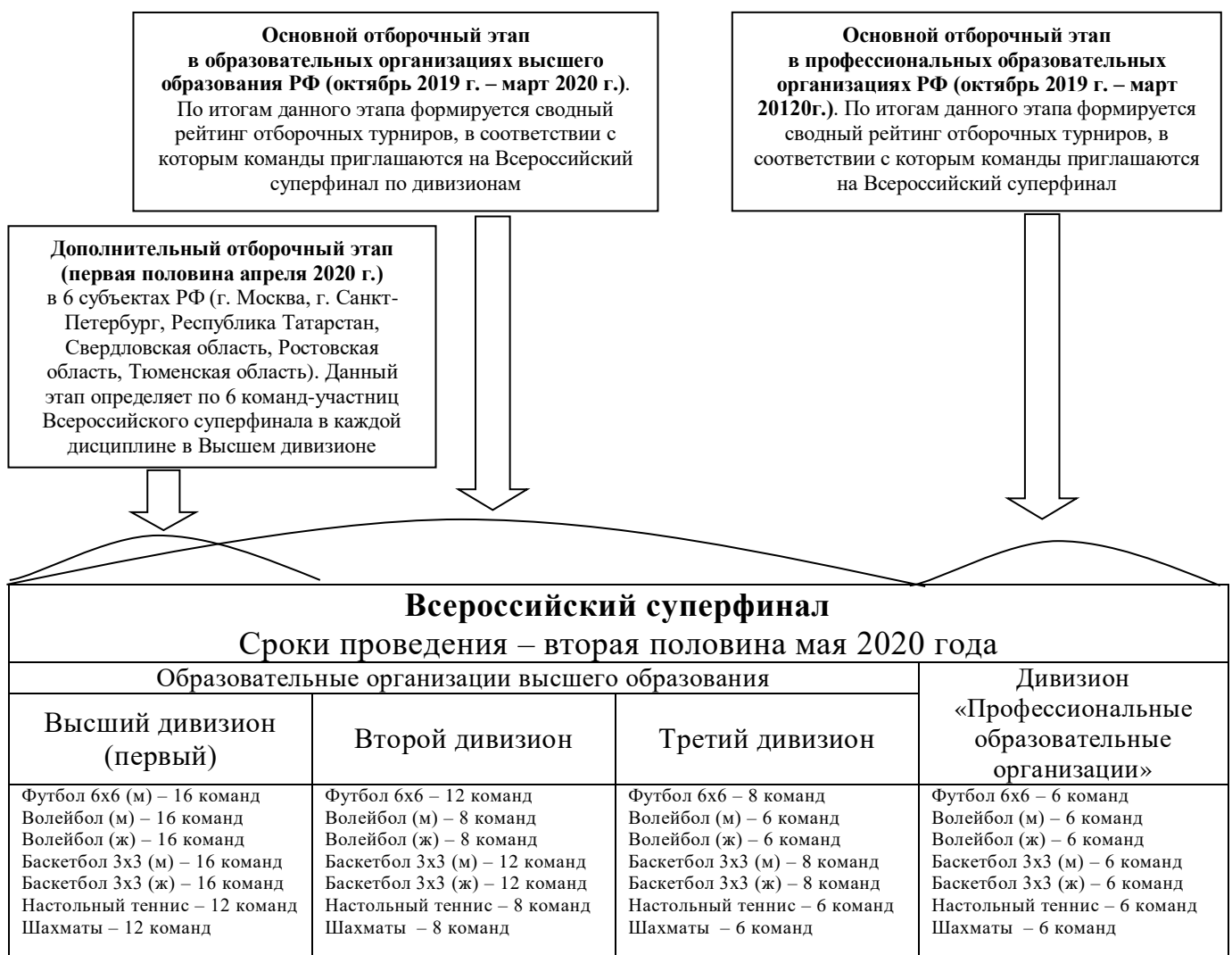
Рисунок 1 – Схема Чемпионата АССК России 2019-2020

Третий дивизион – образовательные организации высшего образования с количеством обучающихся по очной форме обучения до 2500 чел.