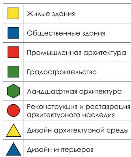
Рис. 3 Символы обозначения направлений по номинации «Курсовой проект»