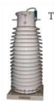
Трансформатор напряжения НКФ-110