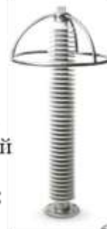
Ограничитель перенапряжений нелинейный ОПН-П-110/88