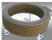
Трансформатор тока ТВ-110