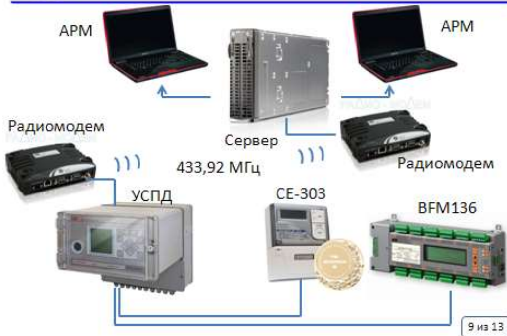
Рис. 6. Пример листа с рисунком