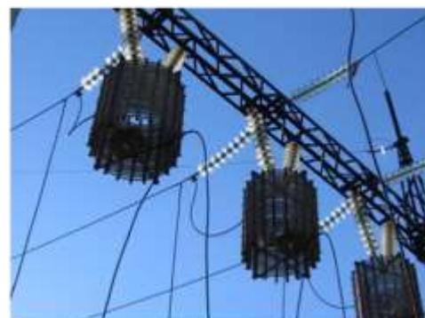
ВЧ-заградитель с конденсатором связи