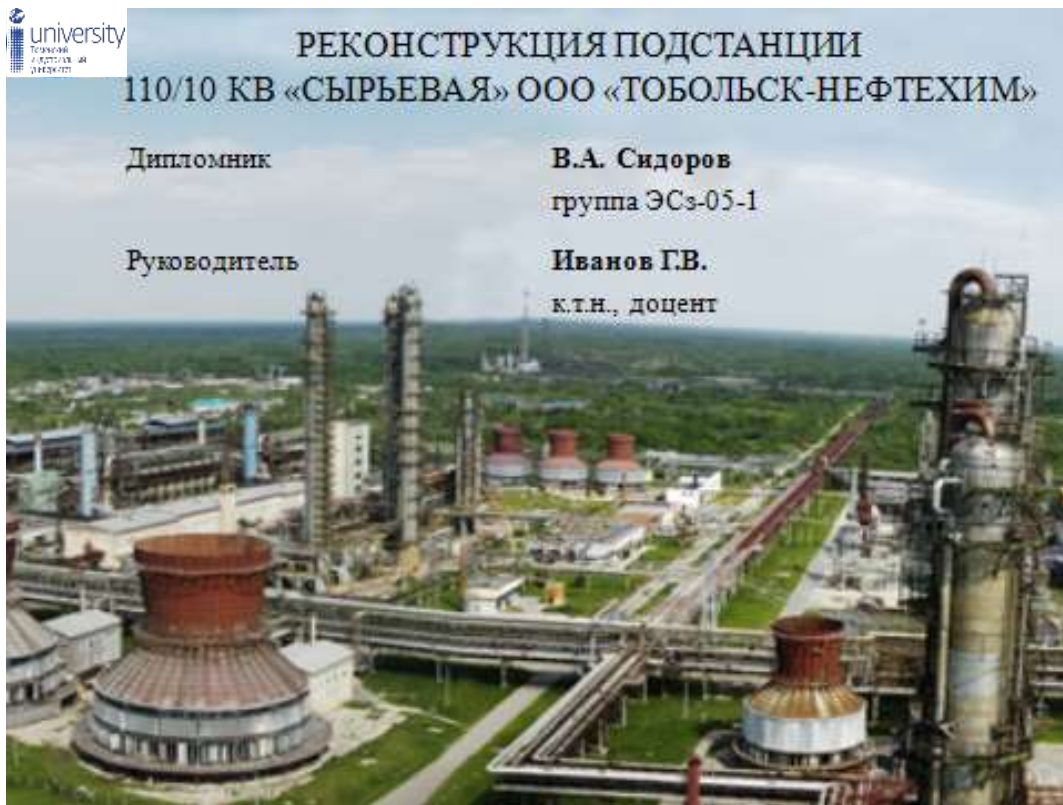
Рис. 5. Пример оформления титульного листа