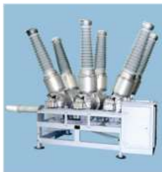
Элегазовый выключатель ВГУ-110/40/31,5