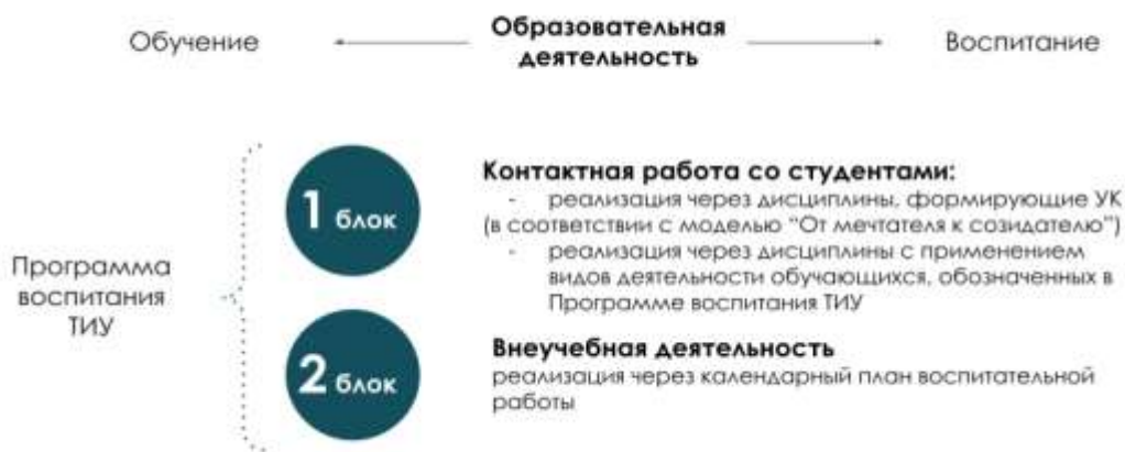
Рис. 1 Воспитательная компонента в образовательном пространстве

Воспитательная компонента встраивается в образовательное пространство ТИУ в соответствии с компетентностной моделью «От Мечтателя к Созидателю» (в соответствии с Программой воспитания ТИУ «Созидатель – мой образ жизни») через два блока (рисунок 1):