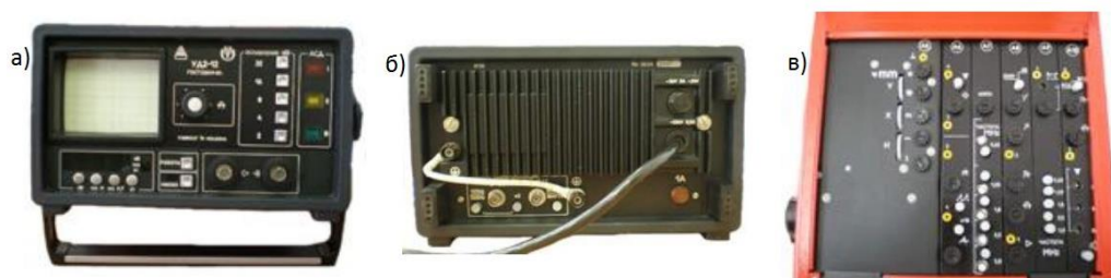
Рисунок 3.5 - Электронный блок УД2-12: а – электронный блок; б) – электронный блок, вид сзади; в) – настроечная панель.

Выше и ниже каждой иллюстрации должно быть оставлено не менее одной свободной строки.