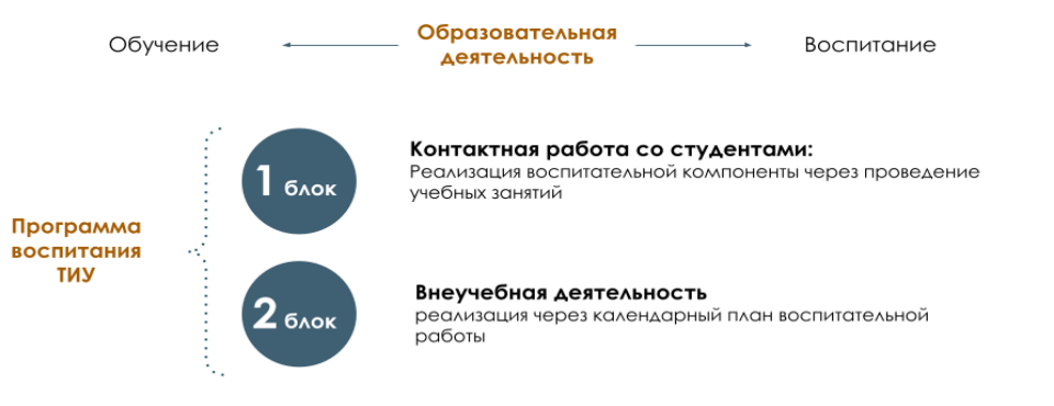
Рис. 1 Встраивание в образовательное пространство воспитательной компоненты