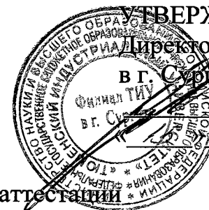
График проведения осенней промежуточной аттестации на 2023-2024 учебный год