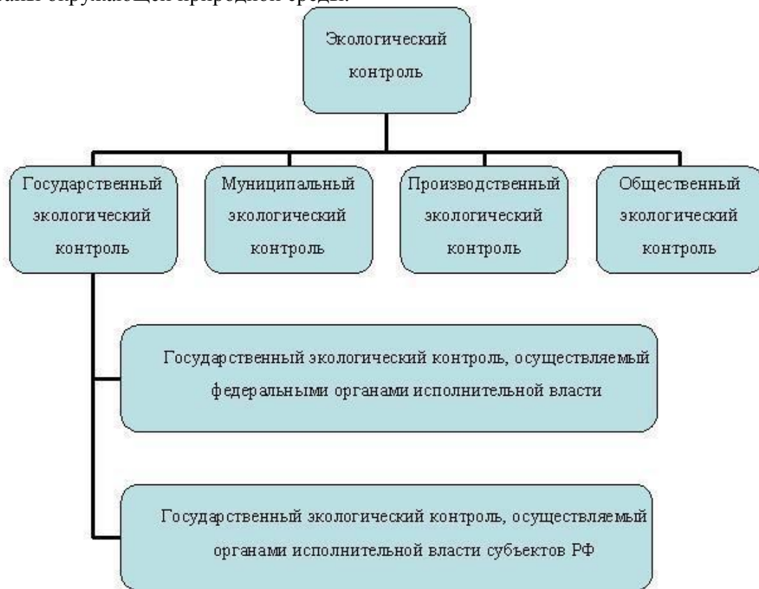
Рисунок 1 – Виды экологического контроля