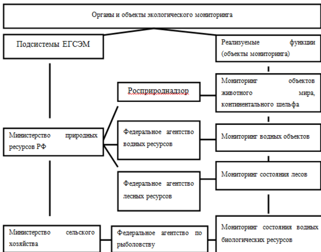
Рис. 2. Основные подсистемы ЕГСЭМ и их функции

В систему мониторинга должны входить следующие основные процедуры