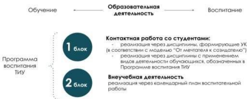
Рис. 1 Воспитательная компонента в образовательном пространстве

Воспитательная компонента встраивается в образовательное пространство ТИУ в соответствии с компетентностной моделью «От Мечтателя к Созидателю» (в соответствии с Программой воспитания ТИУ «Созидатель – мой образ жизни») через два блока (рисунок 1):