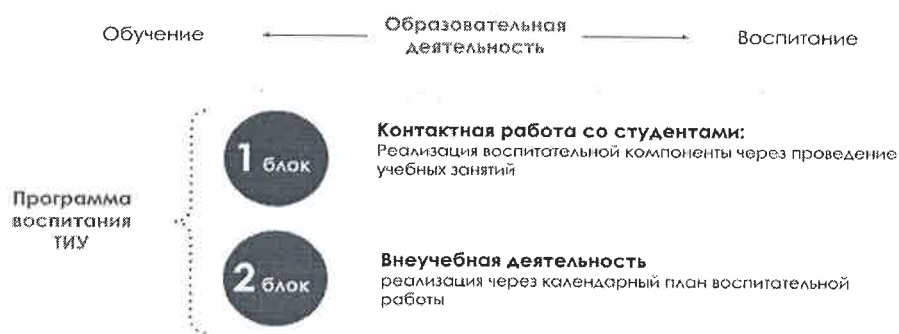
Рис. 1 Встраивание в образовательное пространство воспитательной компоненты