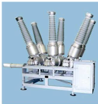
Элегазовый выключатель ВГУ-110/40/31,5