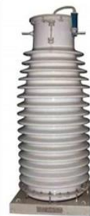
Трансформатор напряжения НКФ-110