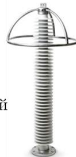
Ограничитель перенапряжений нелинейный ОПН-П-110/88