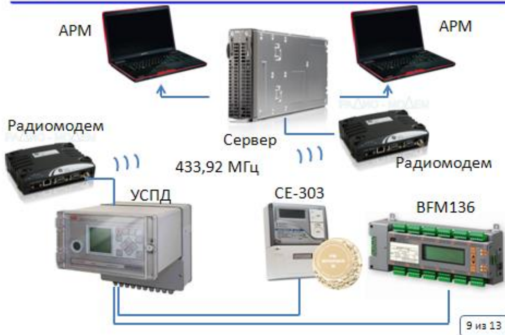
Рис. 6. Пример листа с рисунком