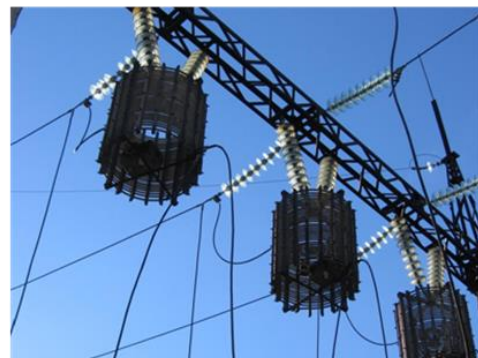
ВЧ-заградитель с конденсатором связи