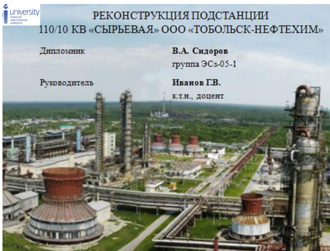
Рис. 5. Пример оформления титульного листа