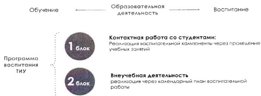
Рис. 1 Встраивание в образовательное пространство воспитательной компоненты