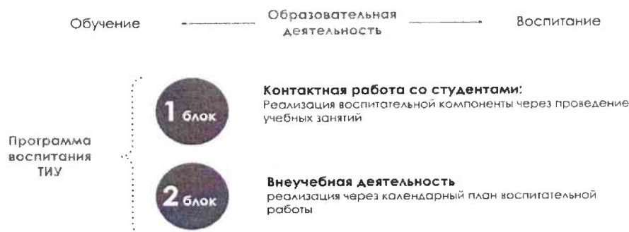
Рис. 1 Встраивание в образовательное пространство воспитательной компоненты