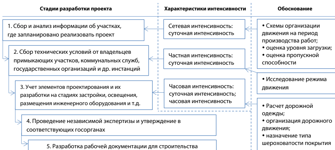
Рис. 1. Использование данных об интенсивности движения на стадиях разработки проектов

ражающие потребность населения в перемещении на автомобильном транспорте.