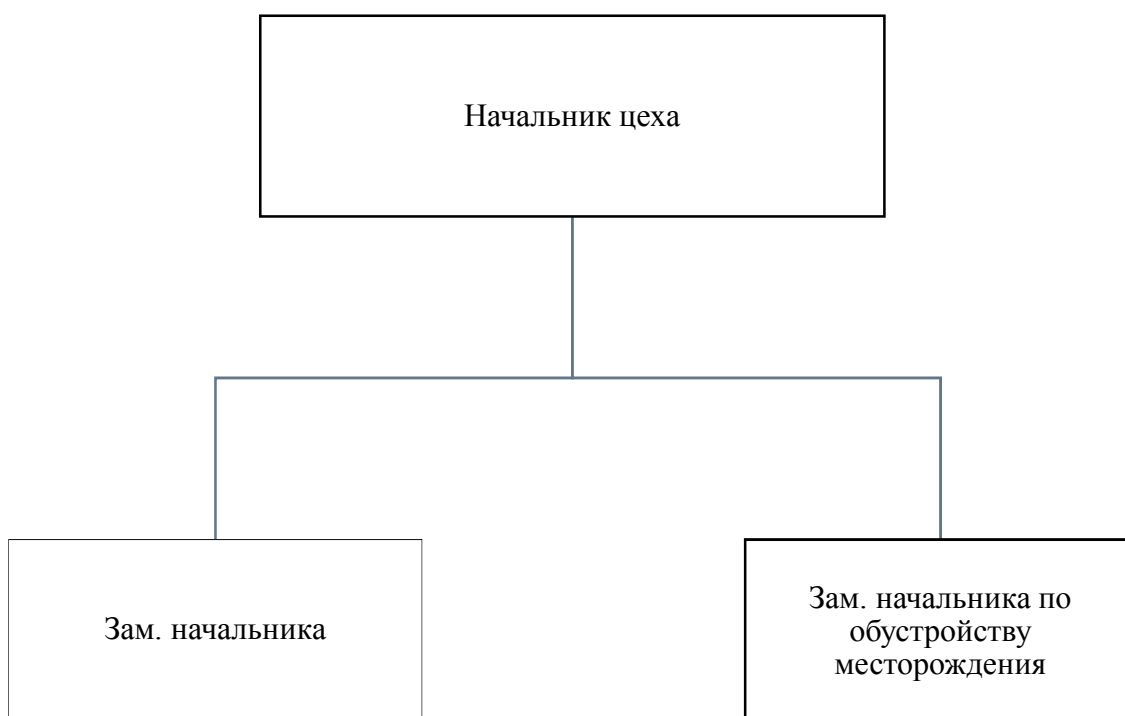
Рисунок 4.2 – Схема

Выше и ниже каждой иллюстрации должно быть оставлено не менее одной свободной строки.