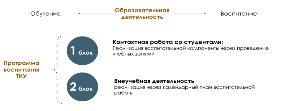
Рисунок 1 – Встраивание в образовательное пространство воспитательной компоненты