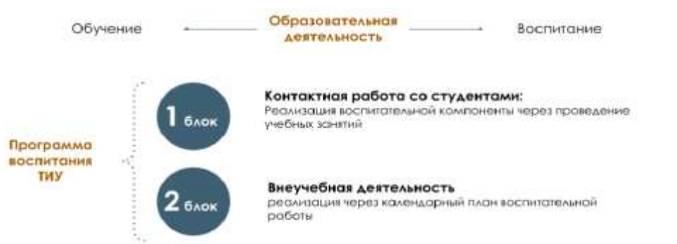
Рис. 1 Встраивание в образовательное пространство воспитательной компоненты