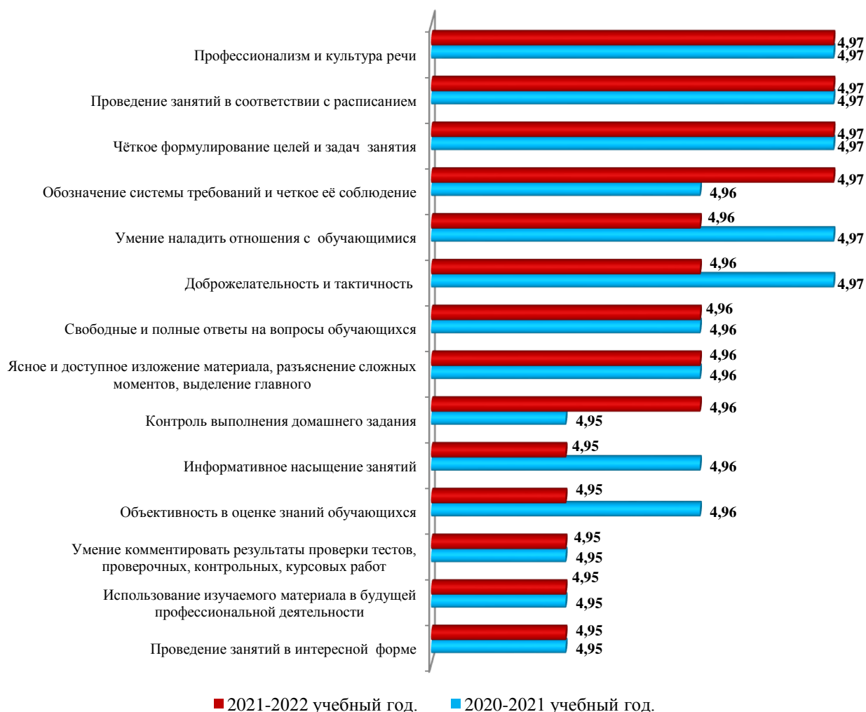
Рисунок 2 – Средние баллы по критериям, характеризующим деятельность преподавателей СПО, входящие в рейтинг «ТОП-50» преподавателей университета, получивших самые высокие баллы