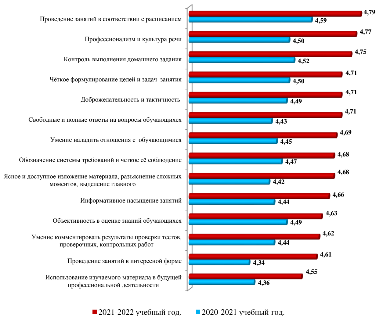
Рисунок 3 – Средние баллы по критериям, характеризующим деятельность учителей общеобразовательного лица, получивших баллы по результатам своей деятельности в 2021-2022 учебном году

Средние баллы по каждому критерию, характеризующему профессиональную деятельность учителей общеобразовательного лица, получивших баллы по результатам своей деятельности в 2021-2022 учебном году, представлены на рисунке 3.